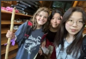
현지인 참여 수업 및 액티비티 영어 및 Sports Arts Kpop 클럽