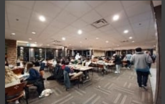
UBC 기숙사 카페테리아 동서양 망라 뷔페식 식사 매일

가격 CAD 8,750 + 등록비 CAD 1,000(별도) 기간 4 주, 25 년 7 월 20 일 (일) 인천 출발 ~ 8 월 15 일 (금) 인천 도착 대상 만 10 - 14 세 포함 내용 *겨울 일정은 별도 공지 안내 ✓ 캐나다 최고 명문 대학 UBC 에서 진행되는 영어캠프 현지 교과 수업 - 현지인 임용 교사에 의한 현지 교과 수업 영어 강화 수업 - 스피킹 및 라이팅 튜터 수업 (소수정원제 ~10 명) 현지인 참여 수업 - Debating, Presentation, Group Project, Book Report 등 클럽 액티비티 - Sports, Arts, Kpop 등 현지인과 같이 하는 액티비티 특별 활동 - 수영, 하이킹 및 한국 수학 수업 등을 포함하는 특별활동 ✓ 현지인 어드벤처 캠프 - 5 박 6 일간 현지인 친구들과 야의 및 수상 액티비티 ✓ 록키여행 - 5 박 6 일간의 제스퍼, 밴프, 켈거리 록키산맥 완정 정복 코스 ✓ 밴쿠버 관광 (Canada Place, Stanley Park, Gastown 등), 빅토리아 페리 관광, 휘슬러 관광, 쇼핑물 탐방을 포함하는 다양한 관광 및 체험 ✓ UBC 기숙사 (1 인 1-2 실) 숙박 및 뷔페 식사, 여행자 보험 ✓ 인솔, 24 시간 가디언 서비스, 카톡 단독 현장 리포트