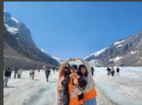
록키 여행 레이크루이스 밴프 아이스필드