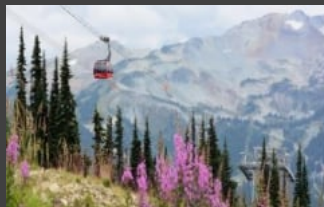
휘슬러 여행 휘슬러 브랜드와인 및 사냥 폭포