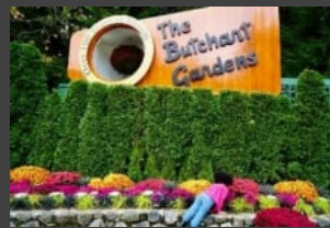
빅토리아 여행 부차드가든 다운타운