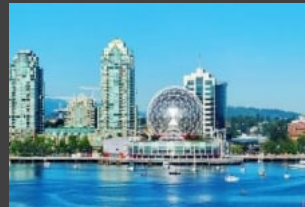
밴쿠버 관광 및 액티비티 스탠리파크 그랜빌아일랜드