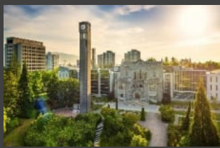
캐나다 명문 UBC 대 영어캠프 현지 교과 및 영어 강화 수업

캐나다 프리미엄 캠프는 다릅니다! 아이들이 또 가고 싶어하는 캠프, 부모님들이 또 보내고 싶어하는 캠프입니다!