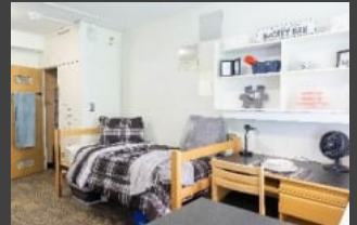
UBC 기숙사 대학 캠퍼스내 기숙사